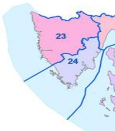
slika broj 1.